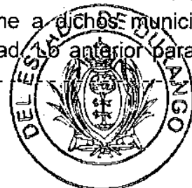
TRIBUNAL ELECTORAL OFICINA DE ACTUARIOS

Actuario por Ministerio de Ley del Tribunal Electoral del Estado de Durango